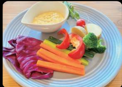
野菜のバーニャカウダ ¥750