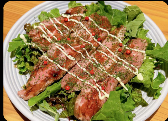
ローストビーフのカルパッチョ仕立て ¥880