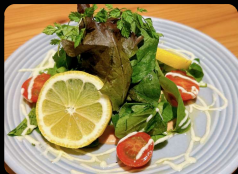
海老とアボカドのタルタル ¥660