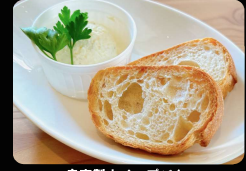
自家製ホイップバター のバケット ¥350