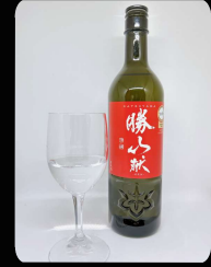
勝山 純米吟醸 献(けん) ボトル1本 ¥9,800 グラス1杯 ¥980