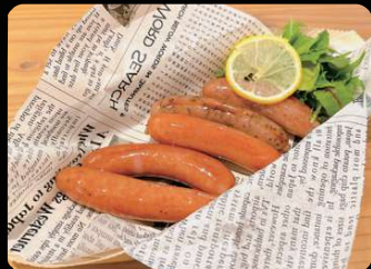
牛タン粗びきウィンナー5種 ¥1,100