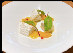
カマンベールチーズ ¥1,000