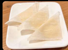
チーズとろカマンベールチーズ ¥500