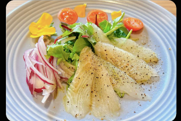
すずきのカルパッチョ ¥1,000