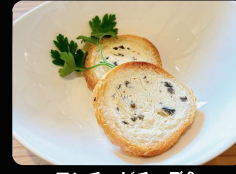
アンチョビチーズ& アルメニット ¥600