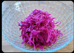
紫キャベツのマリネ ¥300