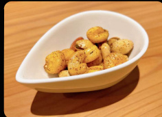
スパイシーミックスナッツ ¥500