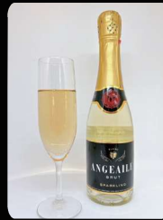
AngeailleBrut (アンジュエール ブリュット) ボトル1本 ¥2,500

★勝山 献(ケン) 2015年 日本最大市販酒鑑評会 SAKE COMPETITION2年連続最の日本1位 2019年 IWCチャンピオン・サケ受賞世界1位 等 受賞多数の有名なお酒です。