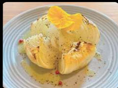
玉ねぎのオープン焼き ¥600