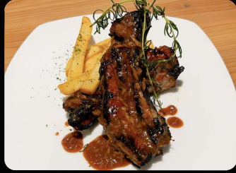
スペアリブポーク ¥1,000