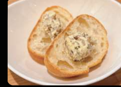
いぶりがっこクリームチーズ のバケット ¥600