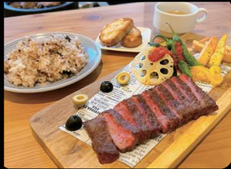
仙台黒毛和牛のステーキセット (ライスorパン+スープ) ¥2,600 (単品 ¥2,500)