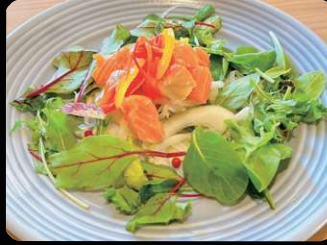
サーモンのマリネ ¥1,100