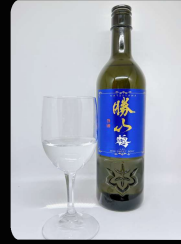
勝山 純米吟醸 鶴(れい) ボトル1本 ¥12,850 グラス1杯 ¥1,340