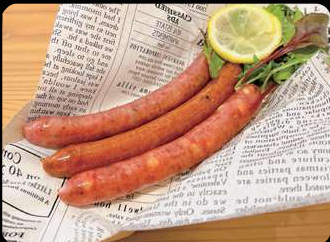
牛タン3種ウィンナー ¥1,100