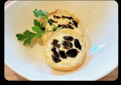
レーズンバター&レパン ¥600